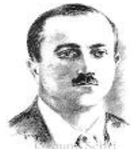
Osman Sebrî 1905 - 1993

Xebat ji bo : * Zordarî ji ser gelê me yê Kurd li Sûriyê rabe.